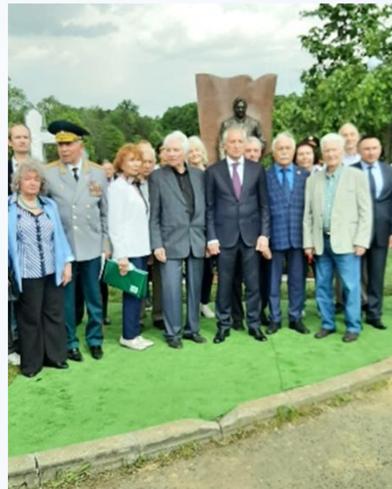
Памятник Томского землячества в Москве