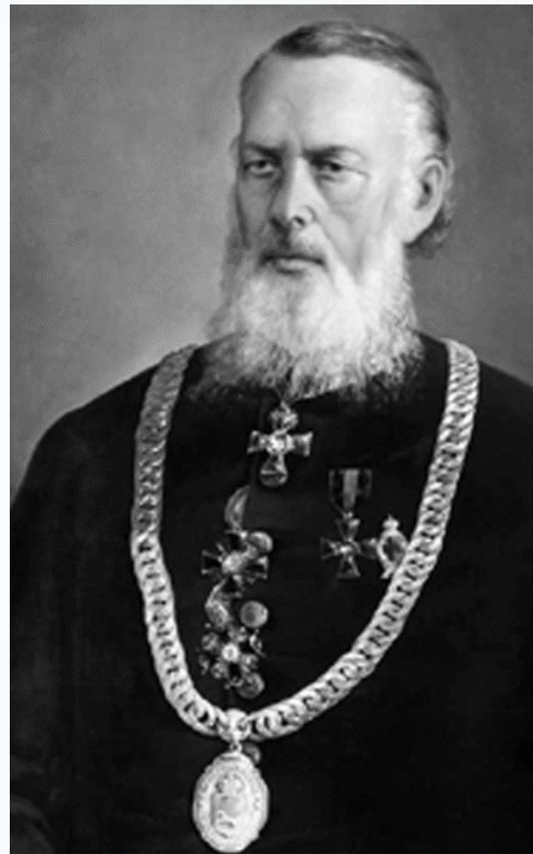
Королёв Евграф Иванович