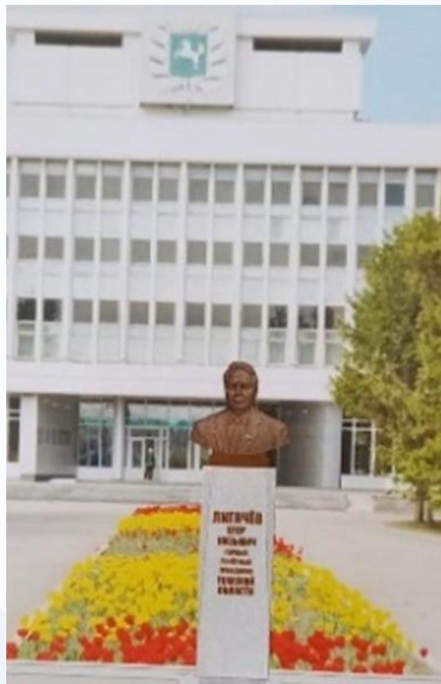
Памятник первому Почётному гражданину Томской области