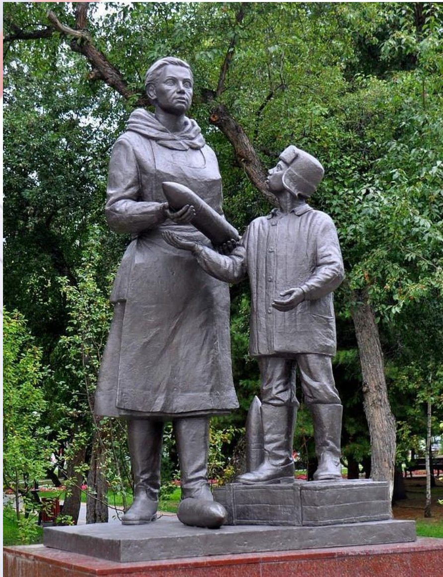
Памятник «Женщине и подростку, ковавшим Победу...»