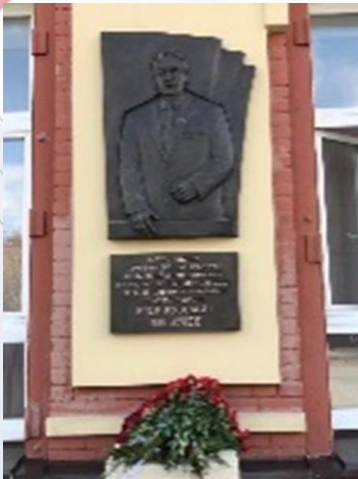
Мемориальная доска первому секретарю Томского ОК КПСС