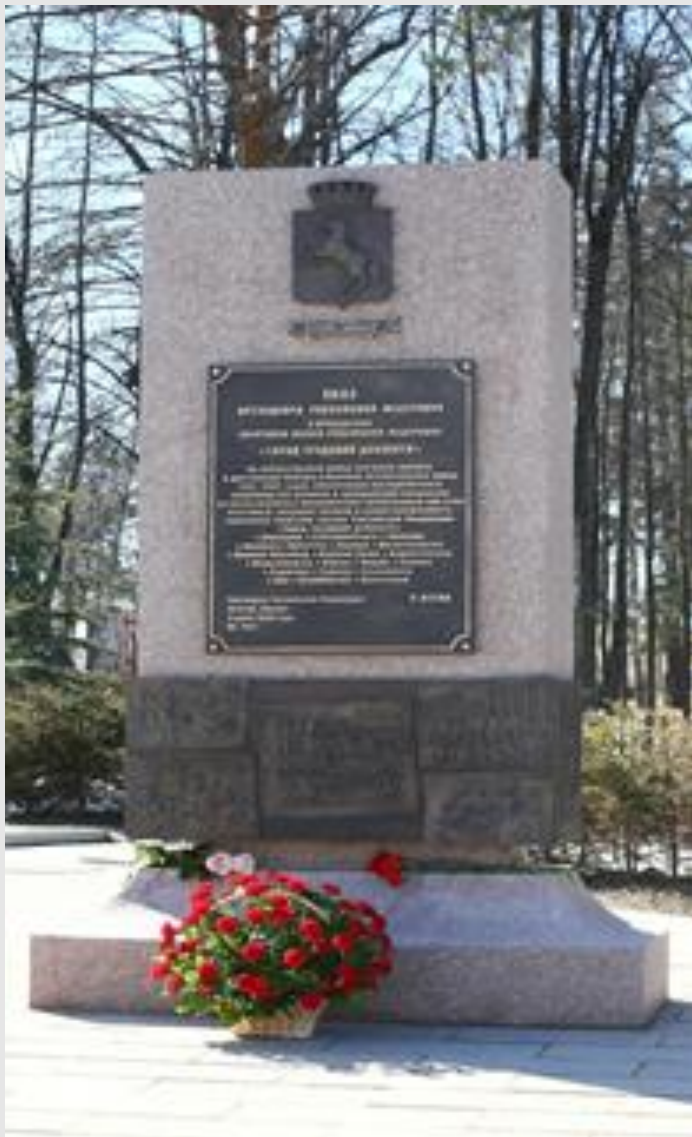
ТОМСК - ГОРОД ТРУДОВОЙ ДОБЛЕСТИ